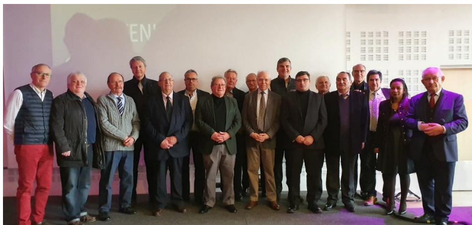
PHOTO DE LA DERNIERE ASSEMBLEE GENERALE DE L'AMICALE EN JANVIER 2020